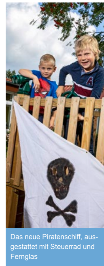
Das neue Piratenschiff, ausgestattet mit Steuerrad und Fernglas